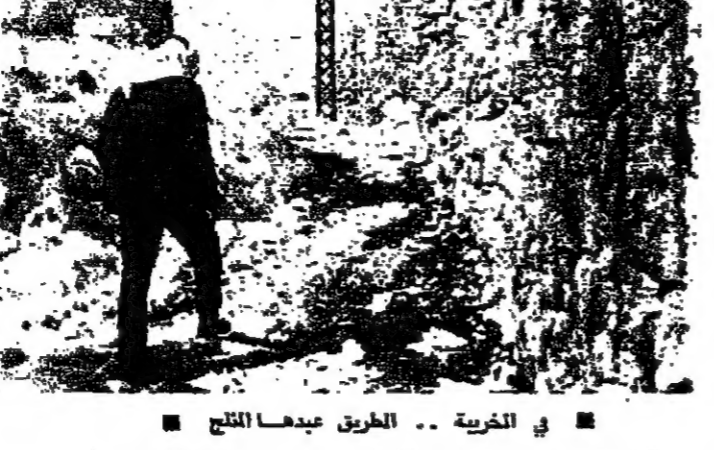
في الخوية .. الحريق عيدها الثلج

زلجة - من مراسل «الأناور» اذا كان التزوح وجها من وجوه التخلف في المناطق، وفي الوقت نفسه سببا من اسبابه، فالعاصفة الحقيقية لصارت في عمق التفرة .. حتى على التزوح. وكثيرة هي القرى البعلبكية المحرومة، لكن قرية «الخوية» في قضاء بعلبك، تعتبر نموذجا «مثاليا» حزينا للنظم الاجتماعي في لبنان. دخلت «الخوية» فراودني شعور كئيب بان المواطن اللبناني ما يزال، في بداية نهاية القرن العشرين، شيئا جدا يفتقر الى التزوق الاولي، والمواطن الذي تحدث عنه، لا يعيش على سعادة بعيدة بعيدة، فالخوية تبعد اكثر من ١٧ كيلومترا عن طريق بعلبك، باتجاه منح الجبل الشرقي، وهي تطو ١٦٠ متر عن البحر.